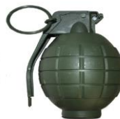
F. Grenade en fragmentation